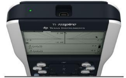
LED indicates the Press-to-Test mode

Laskimen lukitus on nopea ja suositteluin tapa valmistella kämmenlaite kurssikoetta tai YO-koetta varten. Lukituksen purkaminen vaatii toisen laskimen tai tietokoneen.